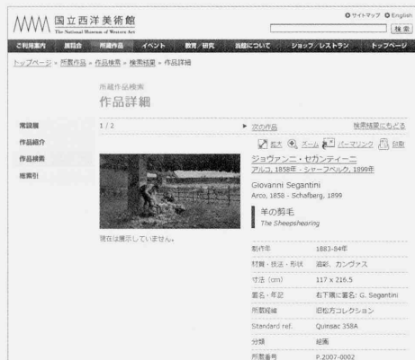
収蔵作品データベース 表示機能改良前

ウェブサイトで公開している収蔵作品データベースについては、従来より作品の基礎データだけではなく、より専門的な来歴・展覧会歴・文献歴等の情報も日英2カ国語で入力し、国際化、情報化の要求に応えるよう努めてきたが、今年度、米国の主要な美術専門誌『Master Drawings』(vol. 48, no. 3, 2010)収録のオンライン・リソース