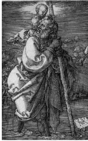
fig.15 デューラー《聖クリストフォルス》、1521年、銅版画

縮法で描かれた動物が画面の隅々までをその輪郭で満たしていて、馬の巨大な臀部は曲線が強調され、馬の量感が際立っている。