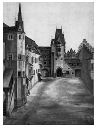
fig.25 デューラー《雲のあるインスブルック城の構内》、1494年、水彩素描、ウィーン、アルベルティーナ美術館