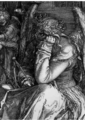
fig.10 デューラー《メレンコリアI》(部分図)

半円を描く二つの陰の形は、画面の最前列で寝そべるライオンのしっぽが繰り返している。このように銅版画《書斎の聖ヒエロニムス》の印象は、科学的な一点透視による遠近法ではなく、光と陰と投影によって作り出される、心地よい白黒の諧調が決定付けていると言ってもいいだろう。聖ヒエロニムスの室内には、砕かれた光の粉が霧となってまんべんなくあらゆるモチーフに光を届けているのに対して、《メレンコリアI》は光源が定まらず、光は拡散している (fig.10)。薄暗い画面には、左上に彗星が虹とともに白い明かりを地上に投げ掛けているものの、それは十分な光を放ってはいない。ところがこの虹と彗星の対角線上に位置する画面右下のメレンコリアの左腕と左足、そしてメレンコリアの足先の球体には強いハイライトがあたり、あたかも薄暗がり沈んでいるメレンコリアの世界に右下から強いサーチライトをあてて覗き見てしまったかのような居心地の悪さを、見る者に感じさせるのである。