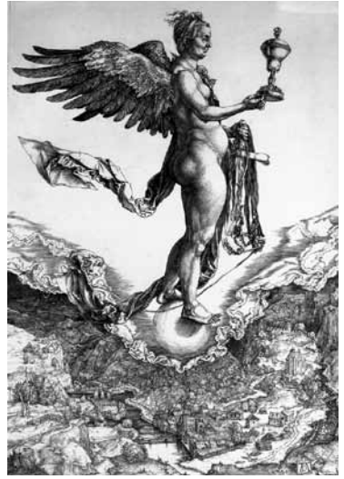
fig.2 デューラー《ネメシス》、1502年、銅 版画