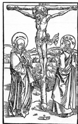
fig.27 デューラー《十字架磔刑》、1493年頃、木版画

また現存する最初期の木版画の一枚である1493年頃の《十字架磔刑》(fig.27)を見ても、同じ造形原理を確認できる。画面中央の十字架をはさんで、右手のヨハネのドレパリーは絵画的に、一方の左手のマリアはあたかも浮き彫り彫刻を彫りつけたように木彫的に表現されており、デューラーの傑作銅版画《書斎のヒエロニムス》と《メレンコリアI》、晩年の傑作油彩画《四人の使徒》といった作品が内包する造形の両義性は、決して北方の芸術に覆い被さったイタリアの影響からだけでは説明がつかないということが明らかであろう。すなわちデューラーは先天的に、異なる視点で描かれた造形を対比させて眺めるという、特殊な習性を持っているのである。