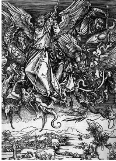
fig.1 デューラー、木版画連作「黙示録」 《大天使ミカエルと竜の闘い》、1498 年頃