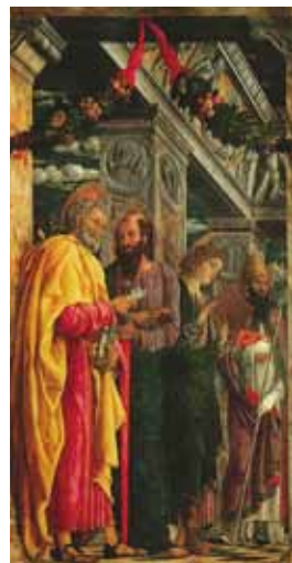
fig.18 マンテーニャ《サン・ゼーノ祭壇画》、1456-60年、油彩画、ヴェローナ、ゼーノ教会(部分図)