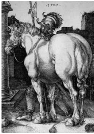
fig.13 デューラー《大きな馬》、1505年、銅版画

が解釈したように、「(馬が)かぶり物と足の翼によってペルセウスもしくはヘルメスと推定できる古典の戦士に曳かれており、知性の高度な力によって統御されている動物の感性」 [48] を描いたとも言えるような、絵画的な小品になっている。ところが同時にデューラーは純粹に彫刻的なマツを持つ馬を描くために、図像的に特別な意味も付与せず、ただ背面から見た馬を《小さな馬》とほぼ同寸の銅版画で制作した [49] 。そのプロセスを示すように、《小さな馬》の方にはA.D.のモノグラムが画面に対して斜めに入り込むように置かれた石の上に彫られているのに対して、《大きな馬》の方は画面の上部に制作年があり、画面右下の陰に目立たないようにモノグラムが書かれているのみである。《大きな馬》では短