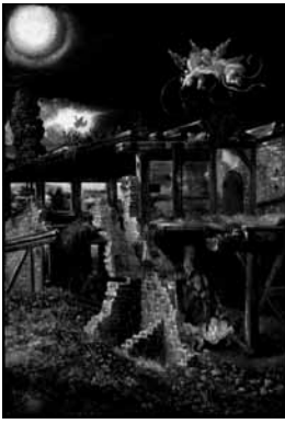
fig.6 アルトドルファー《キリスト降誕》、1511 年頃、油彩画、ベルリン、国立美術館

設定に主眼が置かれているのである。朽ちた木造の家屋の後ろに聳える崩れた塔の上には木々が繁茂しており、ここにロマン主義の「廃墟のある風景」まで一本の道が続く、新しい絵画ジャンルが誕生している。この主題はデューラーの同時代人であるアルブレヒト・アルトドルファー（c.1480–1538年）に代表される、ドナウ派の画家たちによって豊かな展開を見た。アルトドルファーが同主題を油彩画で描いた時（fig.6）、屋根や壁が崩れ落ちたまさしく廃墟の中に植物が生い茂り、夜の月に照らされた建物の陰に聖家族がひっそりと置かれる。ここにおいて絵画の主題はまさしく「自然の生命力」というものによって変わられた [29] 。