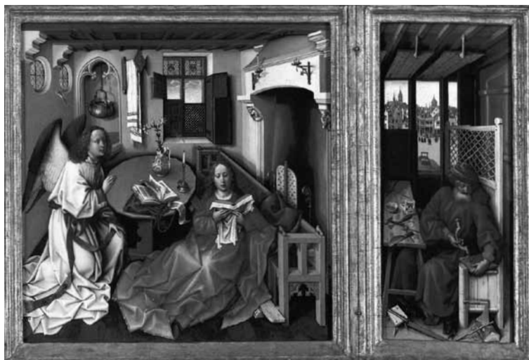
fig.11 フレマールの画家《メロート祭壇画》 (中央パネル《受胎告知》と左翼パ ネル《仕事するヨゼフ》)、1425-30 年頃、油彩画、ニューヨーク、メトロポ リタン美術館

る点も共通していると言えよう。ではこれら二枚の傑作銅版画はどのような順番で並べて見るべきなのだろうか [44] 。この問題を考える上でヒントとなる作品がある。再びフレマールの画家の《メロートの祭壇画》(fig.11)の中央パネル《受胎告知》と右翼パネル《大工仕事をするヨゼフ》と比較してみよう。デューラー