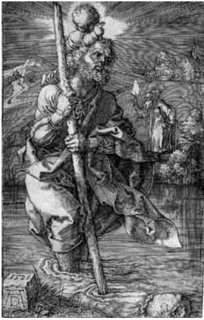
fig.14 デューラー《聖クリストフォルス》、1521年、銅版画

が解釈したように、「(馬が)かぶり物と足の翼によってペルセウスもしくはヘルメスと推定できる古典の戦士に曳かれており、知性の高度な力によって統御されている動物の感性」 [48] を描いたとも言えるような、絵画的な小品になっている。ところが同時にデューラーは純粹に彫刻的なマツを持つ馬を描くために、図像的に特別な意味も付与せず、ただ背面から見た馬を《小さな馬》とほぼ同寸の銅版画で制作した [49] 。そのプロセスを示すように、《小さな馬》の方にはA.D.のモノグラムが画面に対して斜めに入り込むように置かれた石の上に彫られているのに対して、《大きな馬》の方は画面の上部に制作年があり、画面右下の陰に目立たないようにモノグラムが書かれているのみである。《大きな馬》では短