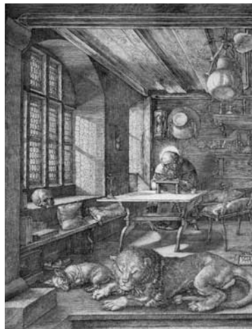
fig.8 デューラー《メレンコリアI》、1514年、 銅版画