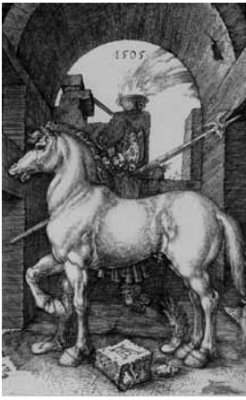
fig.12 デューラー《小さな馬》、1505年、銅版画