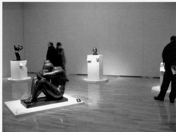
松本会場 Matsumoto Venue

The traveling exhibition organized by the Independent Administrative Institution National Museum of Art, of which the National Museum of Western Art, Tokyo (NMWA) is part, presents art works from the collection of the five National Museums of Art and displays them various regional museums in Japan. This program is held every year with the aim of contributing to the cultural and educational activities of those regional museums. The NMWA was responsible for this year's program and organized an exhibition of works drawn solely from the NMWA collection. Himeji City Museum of Art and Matsumoto City Museum of Art managed the exhibition with the NMWA.