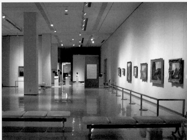
姫路会場 Himeji Venue