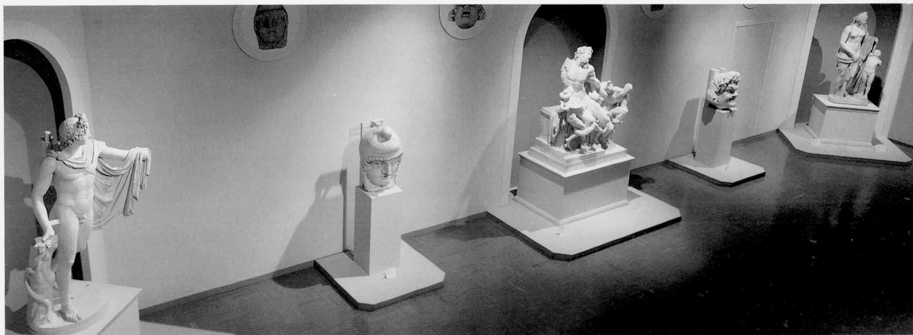
ベルヴェデーレの彫刻庭園:南壁の再現 Belvedere Statue Court: Reconstruction of the South Wall

Transportation and installation: Yamato Transport Display: Nomura Kogei