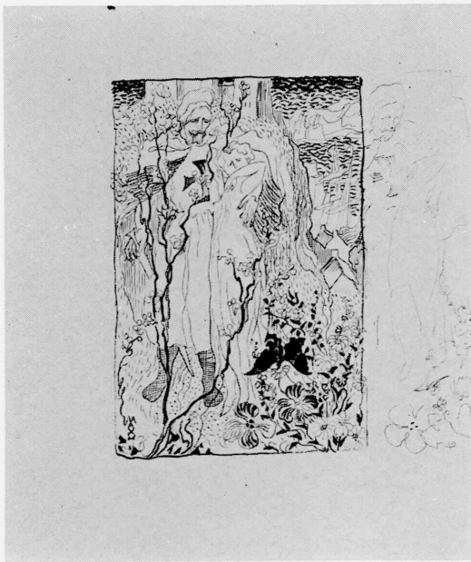
D • 1983-1