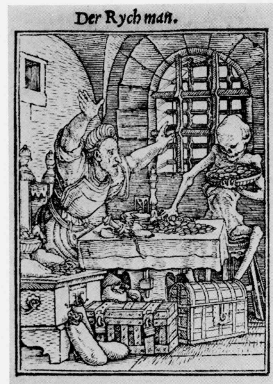
G • 1983-3