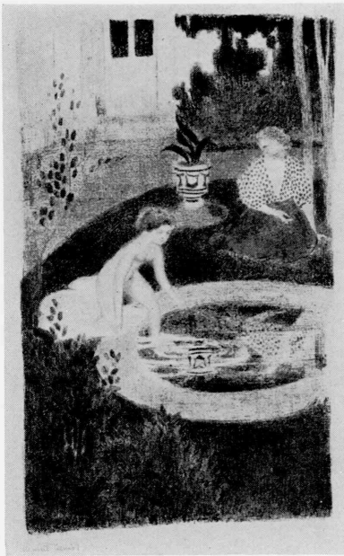
G • 1983-1