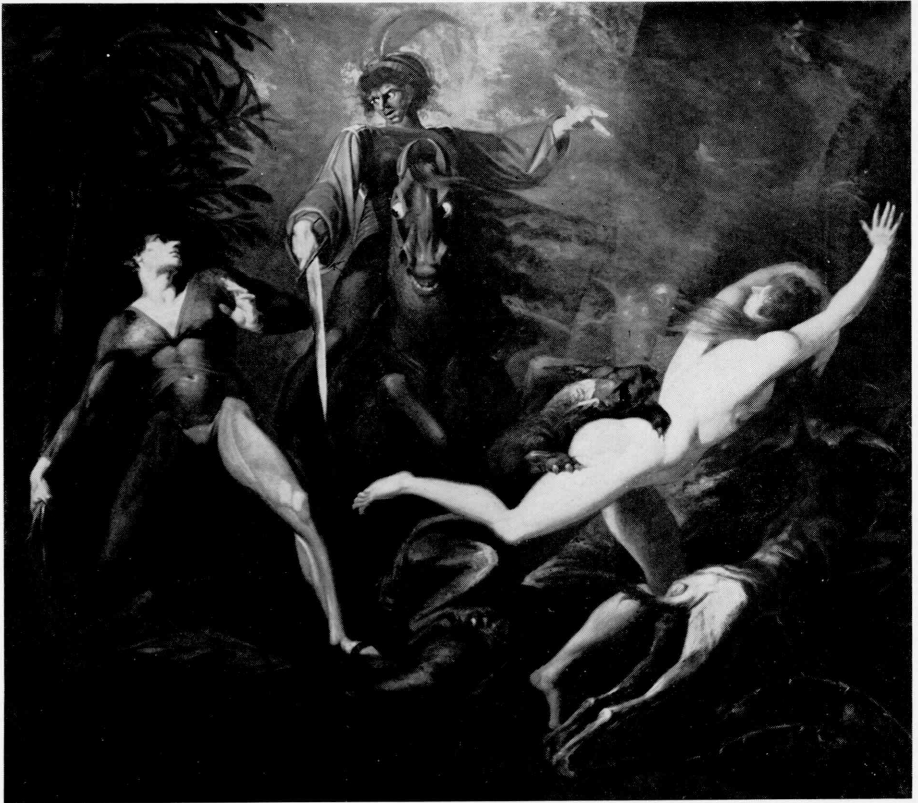
P • 1983-1