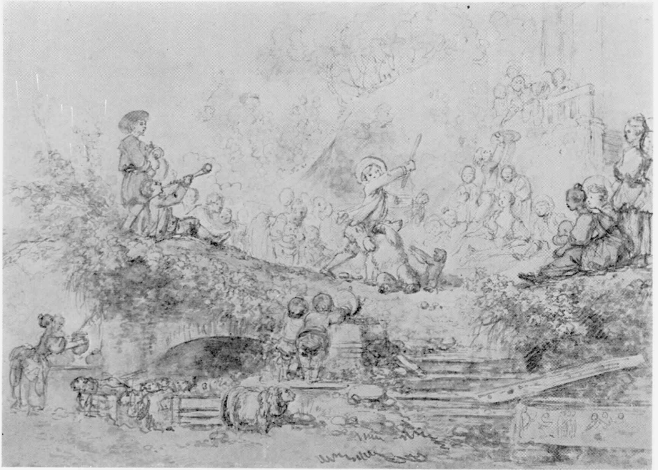
D • 1980-1 Fragonard