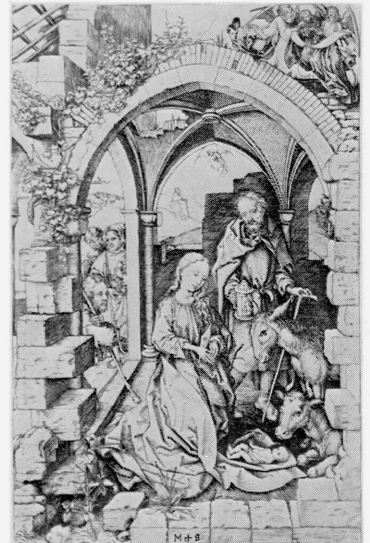
G • 1980-2 Schongauer