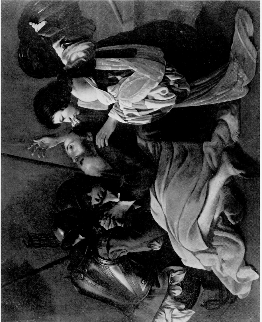
← P • 1980-1 Terbrugghen