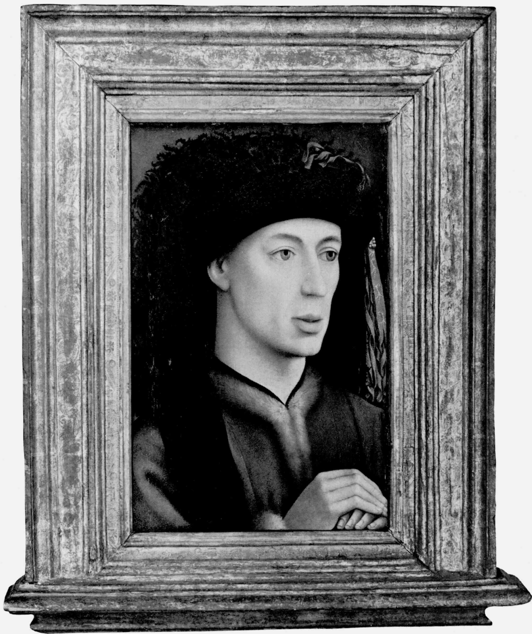
1 Rogier van der Weyden. Portrait of a Man, 1430's. Tokyo, The National Museum of Western Art