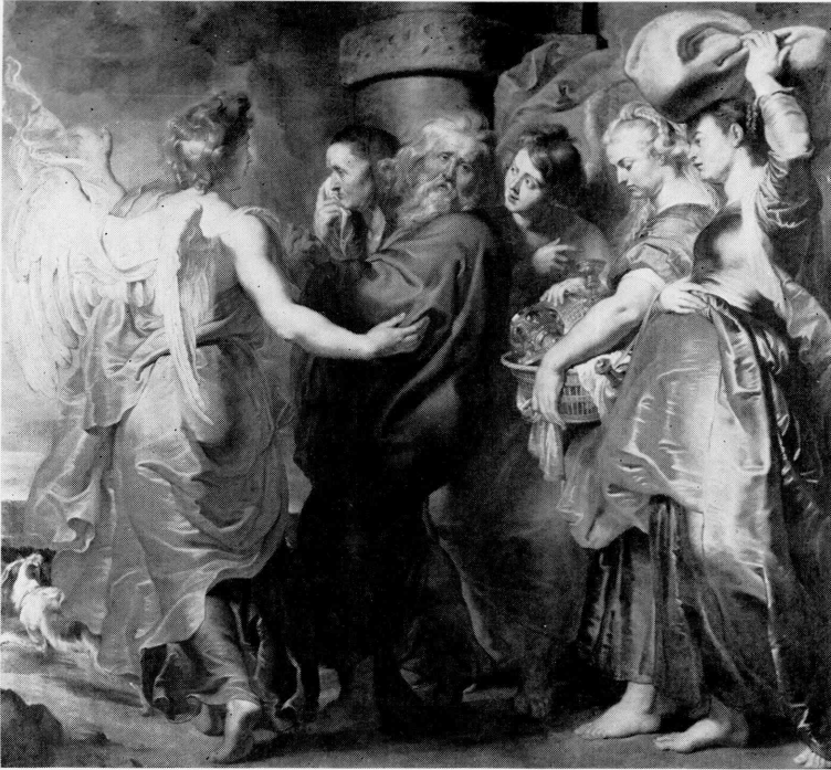
6 Peter Paul Rubens (and Studio). The Flight of Lot and His Family from Sodom. Sarasota, Florida, John and Mable Ringling Museum of Art