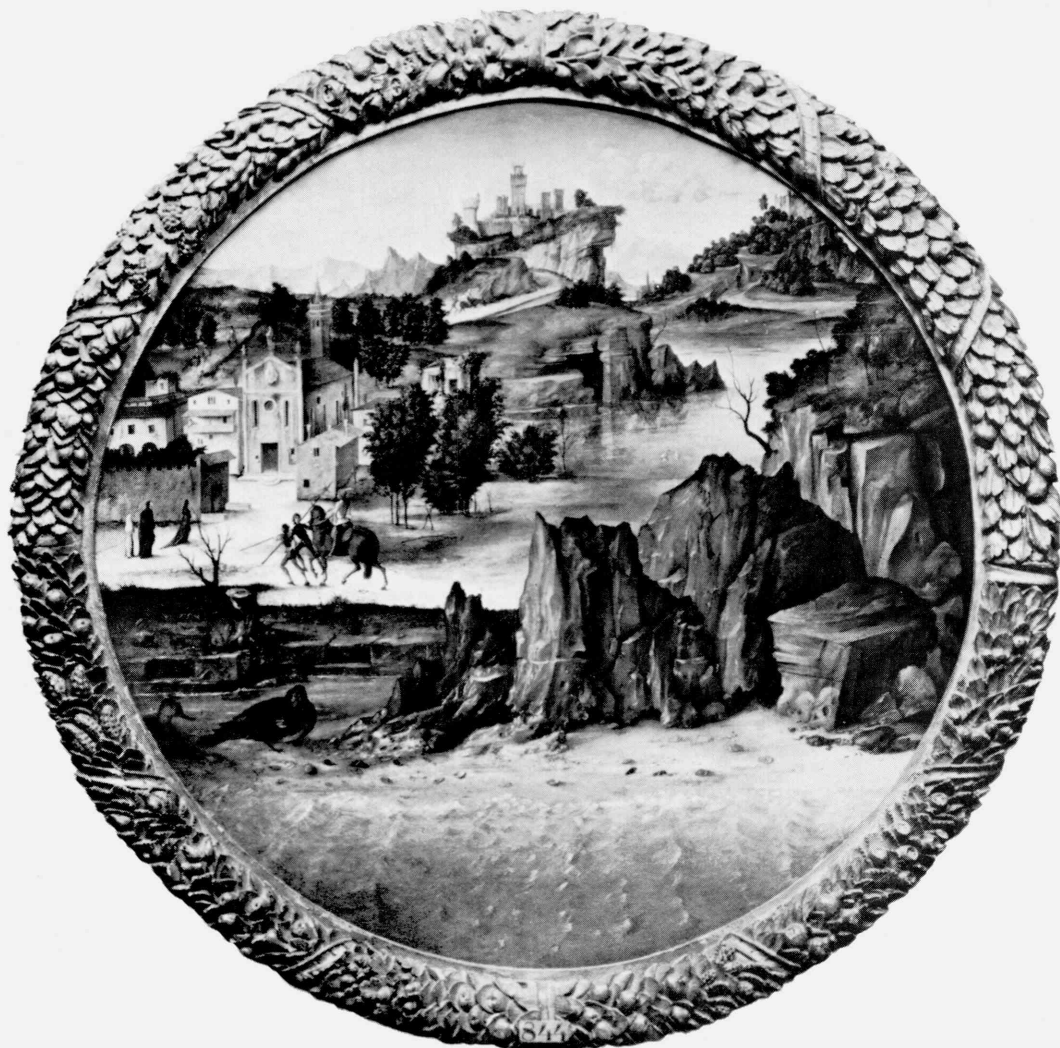
15 Bartolomeo Montagna. Landscape with Castles, c. 1500. Tokyo, The National Museum of Western Art