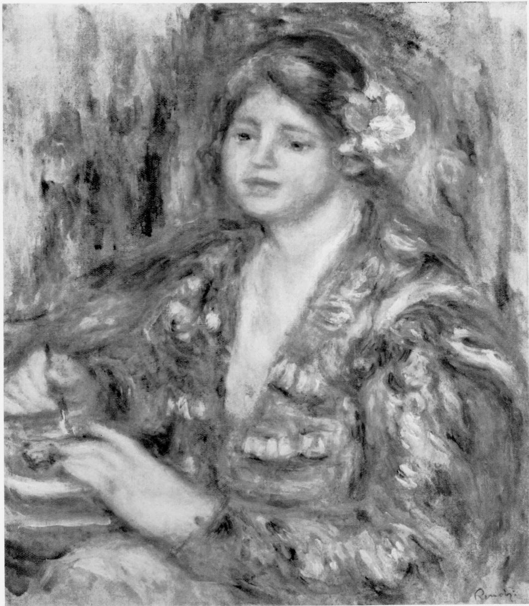
17 Pierre-Auguste Renoir. Woman with Rose, 1919. Tokyo National Museum of Western Art