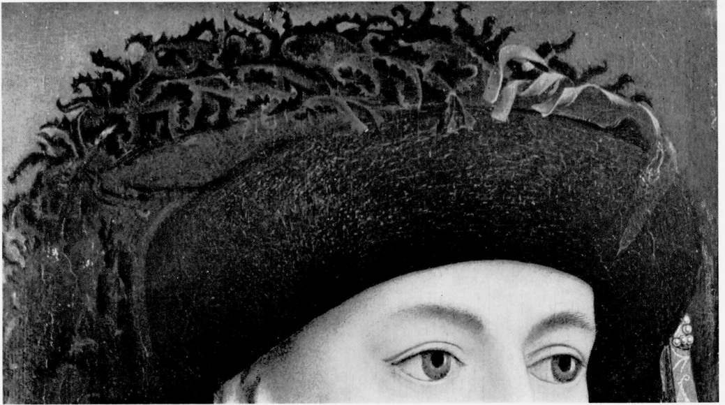
4 Detail of Fig. 1