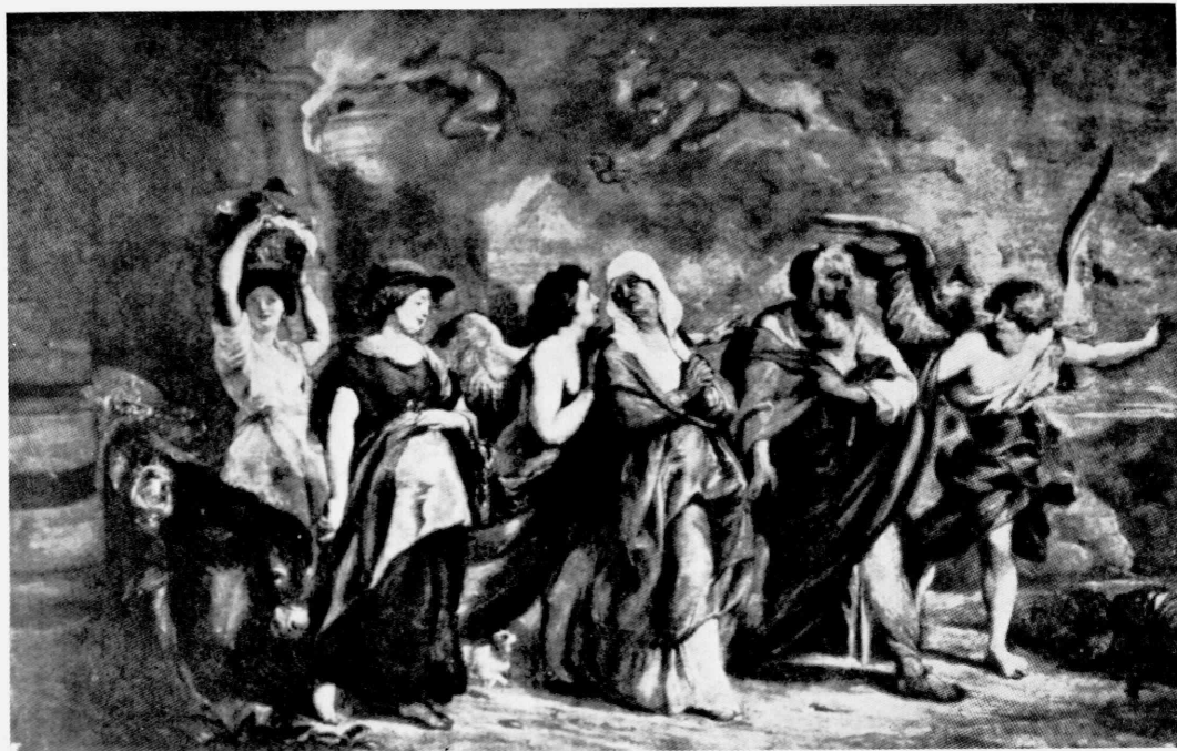
12 Peter Paul Rubens. The Flight of Lot and His Family from Sodom, 1625. Paris, Musée du Louvre