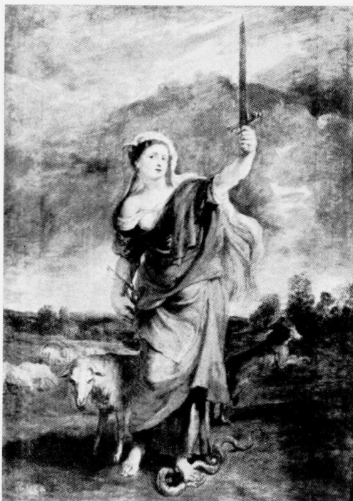
13 Peter Paul Rubens. Justice, c. 1630. Brussels, Artemis, S.A.