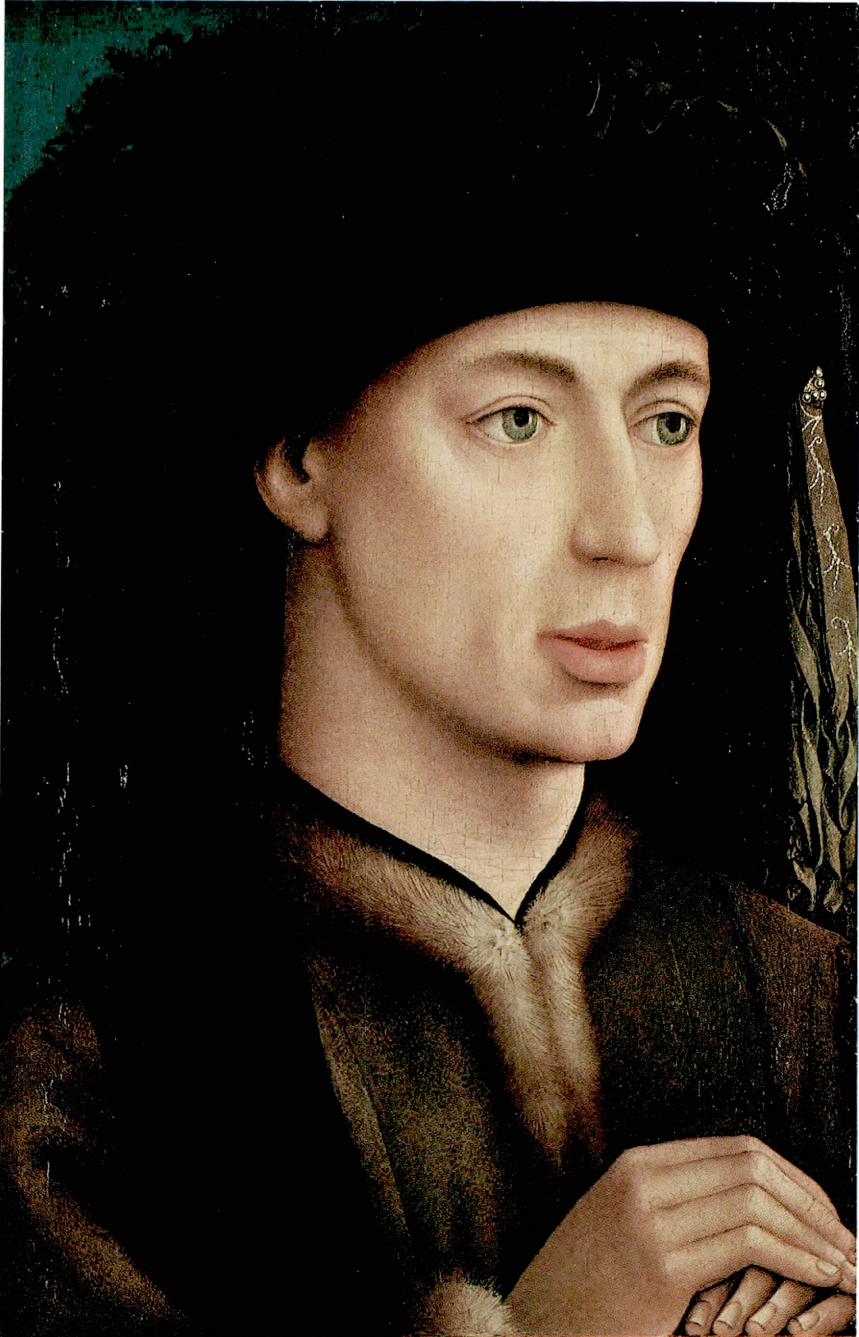
新収作品：ロヒール・ファン・デル・ウェイデン 《ある男の肖像》