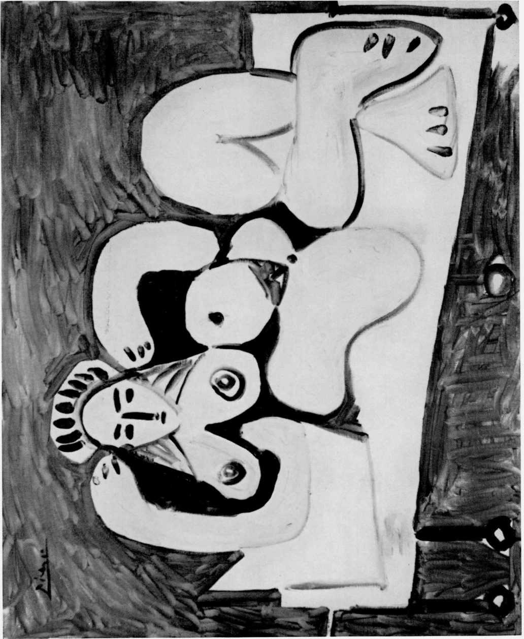
18 Pablo Picasso. Reclining Woman, 1960. Tokyo, The National Museum of Western Art