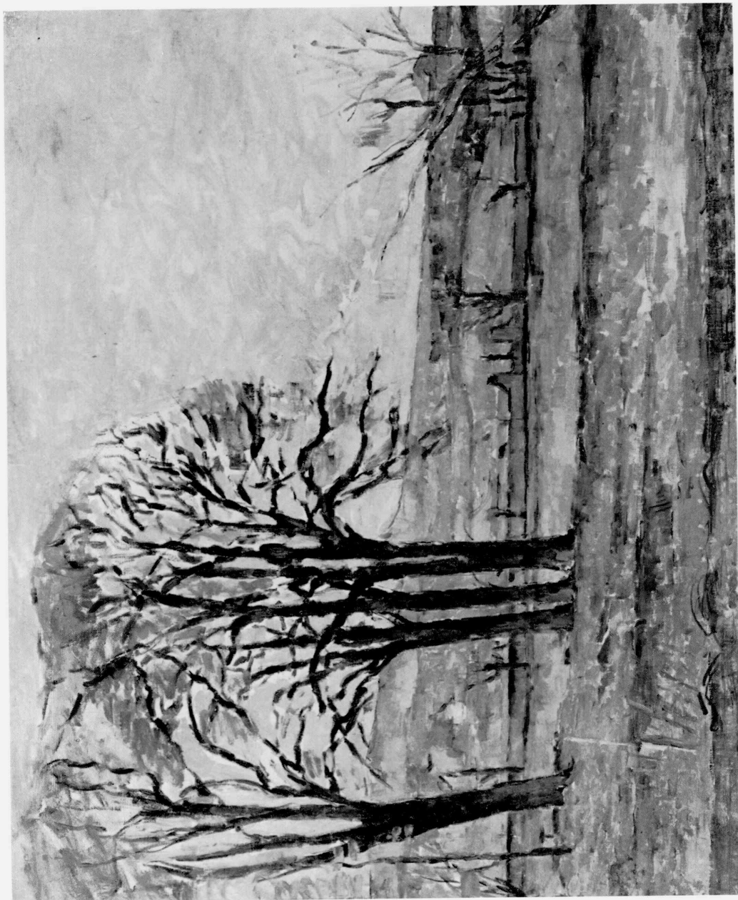
16 Paul Cézanne. Toward the Exit of Jas de Bouffan, 1883-85. Tokyo, The National Museum of Western Art