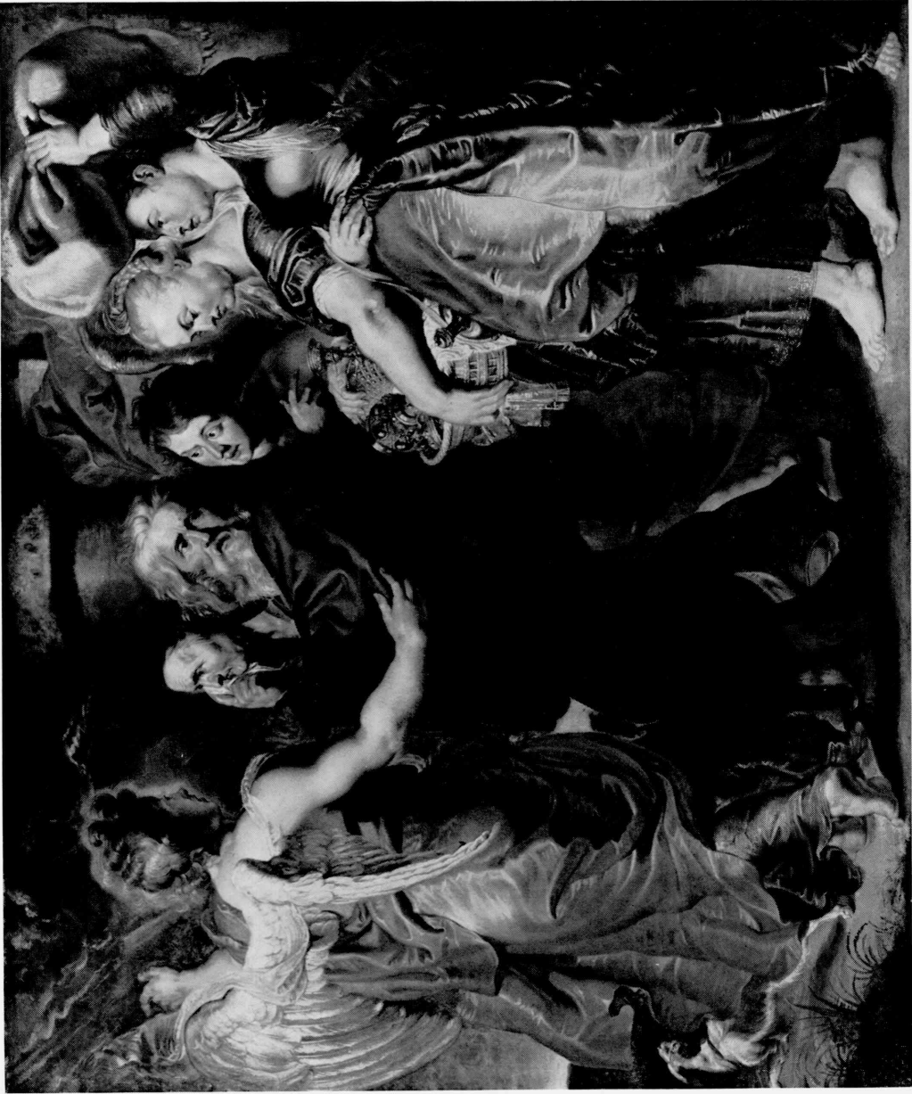
5 Peter Paul Rubens. The Flight of Lot and His Family from Sodom, 1615–20. Tokyo, The National Museum of Western Art