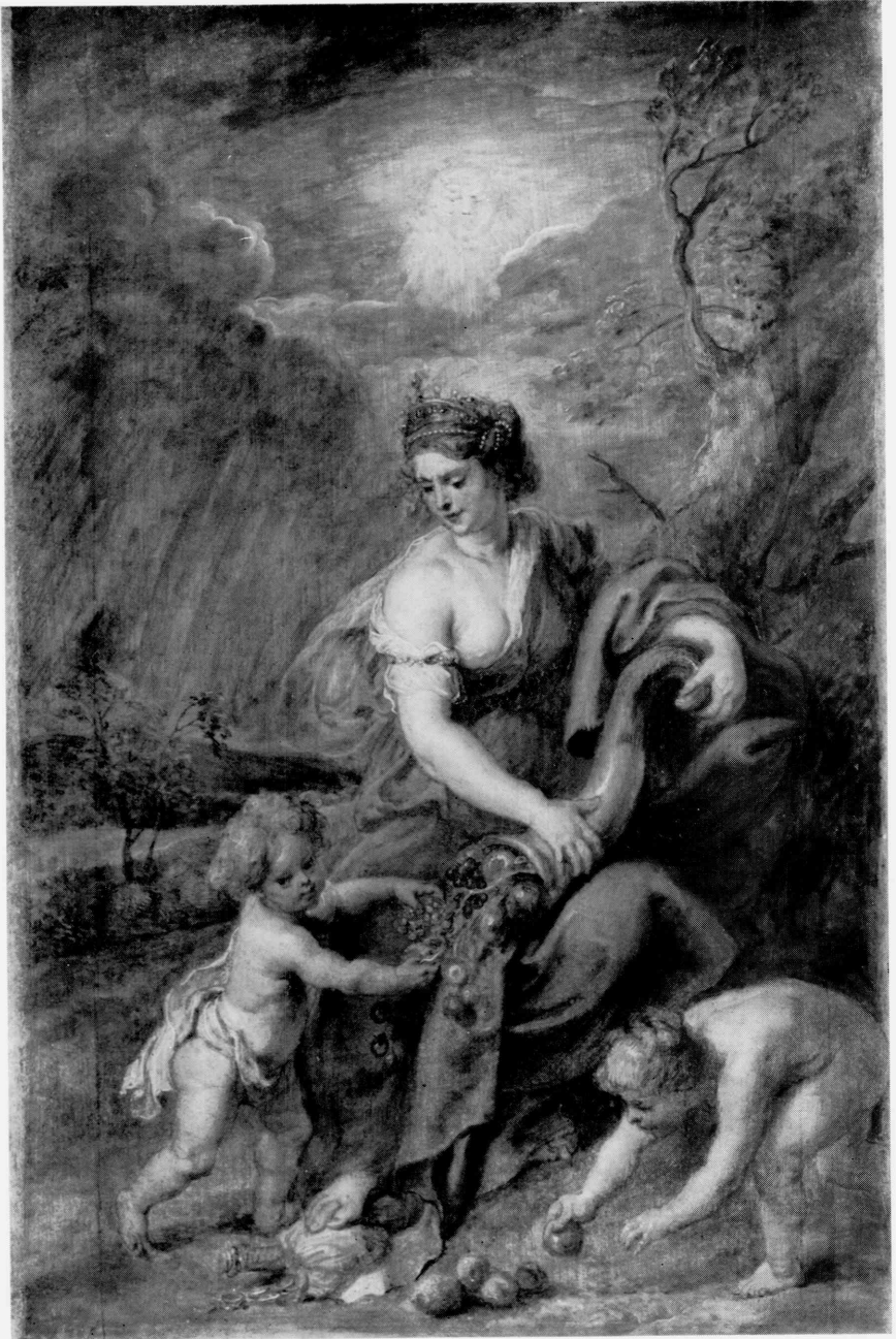
14 Peter Paul Rubens. Abundance (Abundantia), c. 1630. Tokyo, The National Museum of Western Art