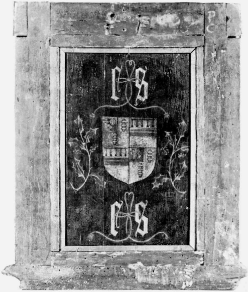
2 Reverse side of "Portrait of a Man" (Fig. 1)