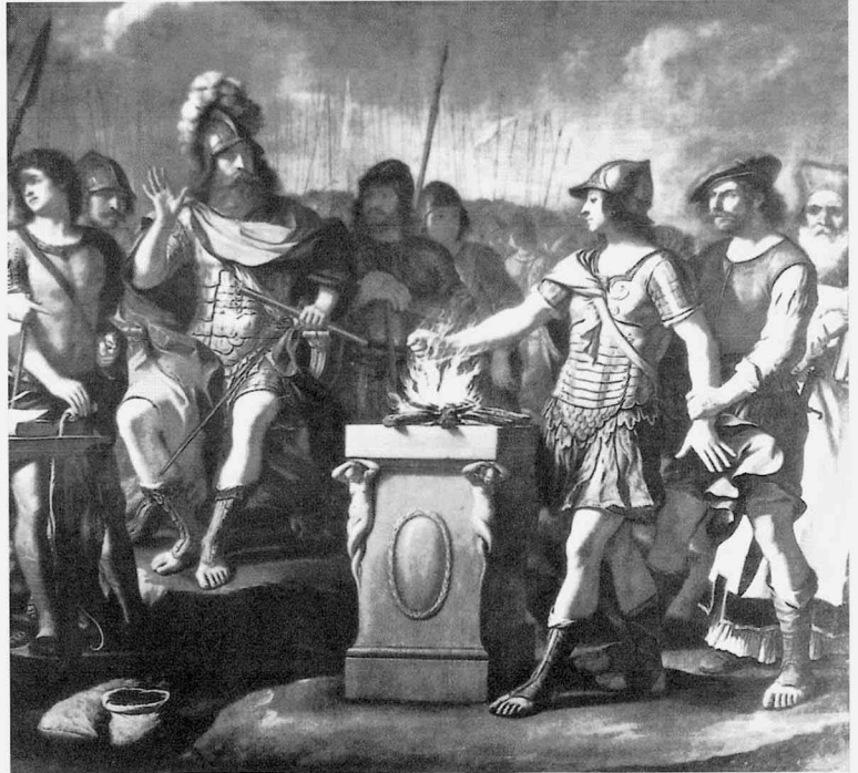
fig.3 グエルチーノ《ボルセンナとムキウス・スカエウォラ》、油彩・カンヴァス、290×282cm、1645-47年頃、ジェノヴァ、パ ラッツォ・ドゥラッツォ＝パッラヴィチーニ

し、ポンペイウスに従った頑なな共和政主義者を主題に選んだことは、この作品の注文主や背景を考える上で非常に興味深い。また、ムキウス・スカエウォラとエトルリアのボルセンナ王の物語を題材にした作品を描いているのも注目に値する(fig.3)。