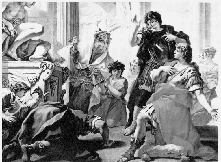
fig.9 セバスティアーノ・リッチ《ユニウス・ブルートゥス》、油彩・カンヴァス、245×301cm、1708年頃、パルマ国立美術館

デルシャウ以来、ダニエルスも、《ユニウス・ブルートゥス》(fig. 9)に関して、主題が正しいかどうか、判断を保留している [12] 。実際、細部を見た場合、中心的な登場人物が3人おり、アポロン神殿において、アポロンの神託を受けているところである。中央の若者は明らかに王族に属する緋色のマントと緋色の脛当てを身にまとい、跪いて託宣を受けるに当たっては、右膝にクッションを