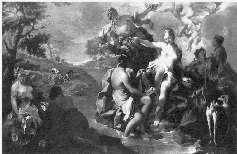
fig.14 ジャンバティスタ・ピットーニ《ディアナとカリスト》、油彩・カンヴァス、149×200cm、1722年頃、ヴィチエンツァ市立美術館

支配者としての女性のイメージは、18世紀前半に非常に人気を博した月の女神ディアナの物語で強く押し出されている。これは歴史画ではなく、オウィディウスの『変身物語』と『祭暦』を典拠とした神話画である。アクタイオンにせよ、カリストの物語にせよ、もちろんティエポロも繰り返し描いている。そして、既に述べたように1722年頃にジャンバティスタ・ピットーニが描いた《ディアナとカリスト》(fig.14)に見られるディアナの姿は、後にスキピオとなる、まさにそのポーズである [19] 。ディアナはまさに“I procul hinc”(ここから遠くへ行っておしまい)と、カリストに非常に強い口調で、アングイラーラ訳に依ると、カシとブナの林に囲まれた聖なる小川から出てゆくよう命ずるのである。この、右手を前につきだしカリストに命令を下すディアナのポーズは、《スキピオとシュファックス》ではスキピオのポーズへと変容する。この作品は、一般には《スキピオと奴隷》という題名を与えられているが [20] 、実際には《スキピオとシュファックス》である。スキピオと捕虜となったスミディア人の王シュファックスとの物語はT・リウィウス『ローマ史』第30巻12-13節に語られるが、リウィウスの記述が直接の典拠となっているわけではない。この作品の対となっている《マッシニッサとソフォニスバ》を考慮に入れ、この場面のスキピオの行為を説明してくれる典拠は、ペトラルカの叙事詩『アフリカ』第5巻325行である [21] 。ここでスキピオは、公私ともに友好を約束したにもかかわらず謀反を起こしたシュファックスに対し、怒りをもって次のように語りかける“Quid tibi, vane Syphax, volusti?”(信用のならぬシュファックスよ、貴様は一体何を企んでいたのだ?)。このとき捕虜となっていたシュファックスは鎖につながれていたが(318行)、マッシニッサと自分の妻ソフォニスバとの経緯を聞いたスキピオは、怒りを静め、再び友情をもってシュファックスと接