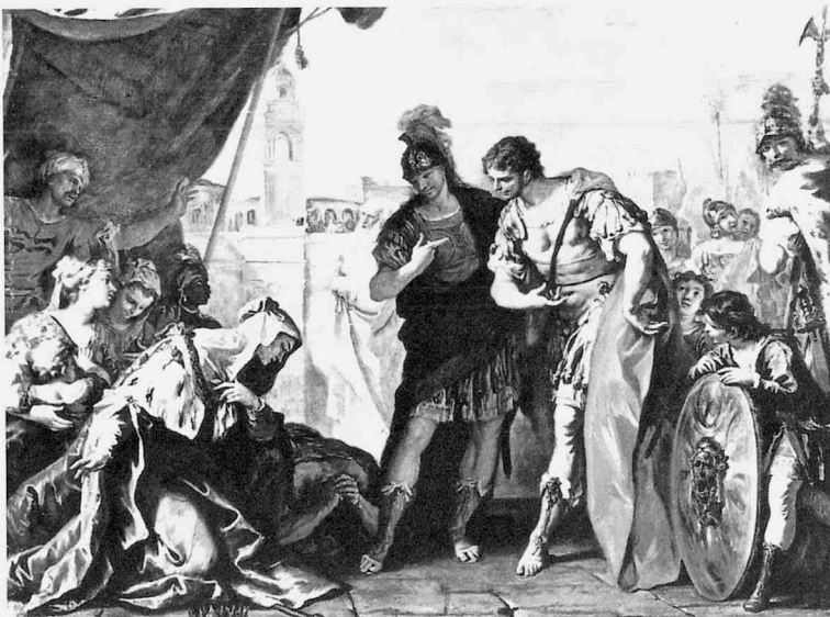
fig.10 セバスティアアーノ・リッチ《アレクサンドロスとダリウスの家族》、油彩・カンヴァス、194×246.5cm、1708-10年頃、ノース・カロライナ美術館

これらの作品や、さらには他の神話主題の作品を見ても、リッチの作品ではいづれも、描かれる人物の表情に見られる感情と典拠となる物語に含まれる劇的要素が一致しているとは言い難い。女性の美しさや男性の肉体の美しさ、そして衣装の美しさ、といった要素が強調される。こうした特徴はピットーニやアミゴーニあるいはペッレグリーニ、そして部分的にジャンバットISTA・ティエポロといった画家たちに引き継がれる。