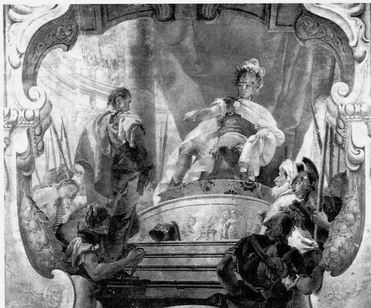
fig.13 ジャンバティスト・ティエポロ《スキピオとシェファックス》、フレスコ、520×450cm、1731年、ミラノ、パラッツォ・ドゥニャーニ